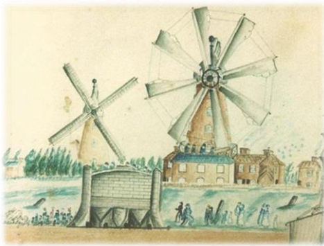
Moulins Pepperbox & Tuxford, 1822