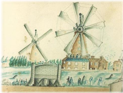
Pepperbox & Tuxford Mills in 1822