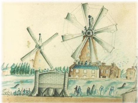
Мельницы «Пеппербокс и Тухфорд» в 1822 году.